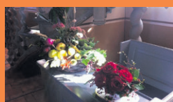
Høst i Sdr. Kirkeby Kirke

Der er høstgudstjenester i Systofte Kirke den 13. september kl. 11.00 og i Sdr. Kirkeby Kirke den 20. september kl. 14.00 og endelig i Nr. Ørslev Kirke den 27. september kl. 11.00. Ved høstgudstjenesten i Nr. Ørslev Kirke vil en præstpraktikant prædike. I Nr. Ørslev og Systofte Kirker er der et traktement i våbenhuset efter høstgudstjenesterne, og efter høstgudstjenesten i Sdr. Kirkeby Kirke er der sammenkomst i Sognehuset.