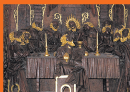
Altartavlen i Sdr. Kirkeby kirke