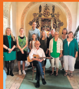
Kirkens kor ved en tidligere lejlighed