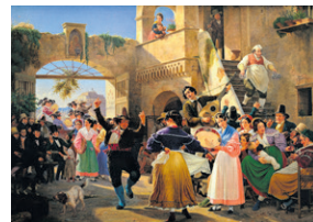
Marstrand: Romerske borgere forsamlet til lystighed (1839)