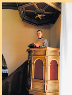
Tidligere praktikant i Nr. Ørslev Kirke

Lolland – Falsters Stift har igennem en år-række inviteret teologistuderende på besøg, så de kan danne sig et indtryk af vores landsdel, og dermed måske få lyst til at søge en ledig stilling her på Sydhavsoerne. De teologistuderende kommer på besøg en weekend og indlogeres hos en lokal præst. I år får vi besøg af to sådanne praktikanter hos os. Det er planen, at praktikanterne skal prædike ved høstgudstjenesten den 27. september kl. 11.00 i Nr. Ørslev kirke og gudstjeneste kl. 09.30 i Sdr. Kirkeby kirke.