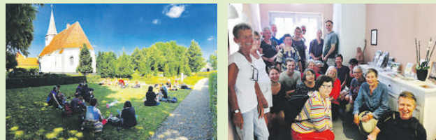
Pilgrimsvandring 2017: Ved Engestofte Kirke og i PilgrimsHuset