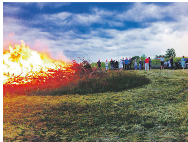
Sankt Hans Sdr. Kirkeby

Lørdag den 23. juni. Vi lægger ud med en kort "midsommerdag" i Sdr. Kirkeby Kirke kl. 17.00 . Dernæst er der mulighed for at nyde den medbragte mad og benytte grill i og omkring sognehuset bag kirken, og siden hen bevæger vi os ud til bålpladsen på marken bagved til båltales, inden bålet tændes.