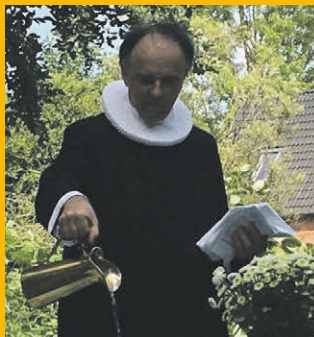
Havedåb 2. pinsedag 2017

Det er planen, at vi fejrer gudstjeneste under åben himmel i Nr. Ørslev Præstegårdshave på 2. Pinsedag, den 21. maj kl. 14.00 . Kirkernes Kor vil medvirke med et par sange, og vi skal have barnedåb i det fri. Der vil efterfølgende også være kaffebord i haven. NB! Såfremt det skulle blive regnvej, rykker vi inden døre i kirken og konfirmandstuen.