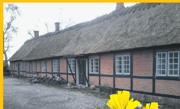
Den gamle bygning har oplevet lidt af hvert