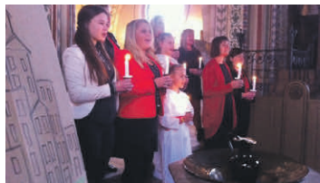
Koret ved en tidligere gudstjeneste