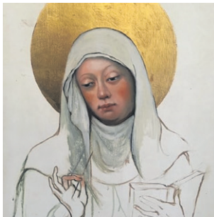
Den Hellige Birgitta