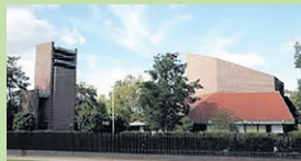
Margrethe kirken i Valby