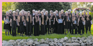
Nykøbing F. koret på Marielyst ved jubileumskoncert i foråret