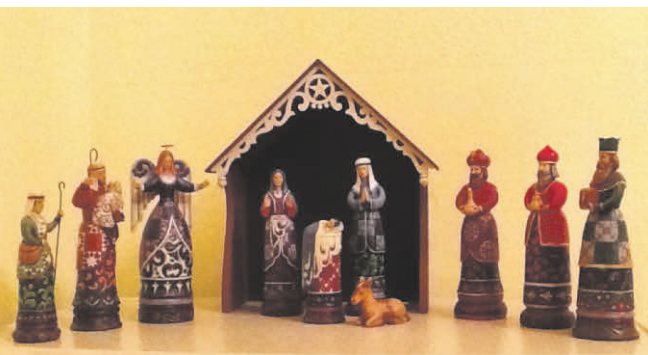
Kunsthåndværk julekrybbe udskåret i træ