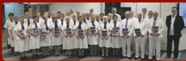
Det Hvide Kor

Tirsdag den 6. december kl. 19.00 med efterfølgende kaffe i Systofte Forsamlingshus. Det Hvide Kor er grundlagt af den legendariske Victor